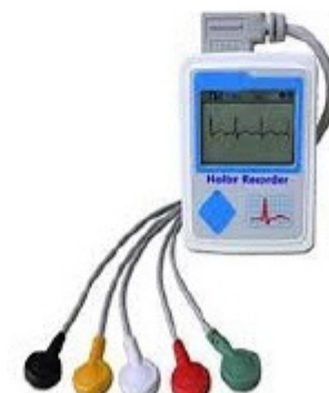
دستگاه ثبت ضربان قلب در ۲۴ ساعت